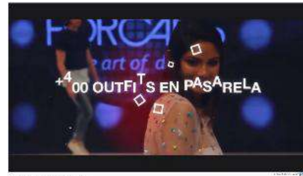
Video: Fashion Show de la FIC 2019 de Perú