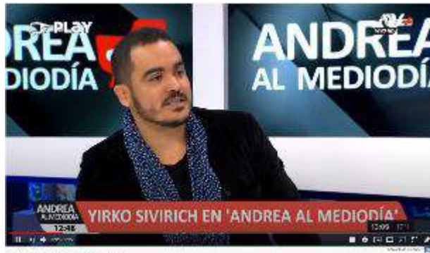
Video: Yirko Sivirich en 'Andrea al Mediodía'